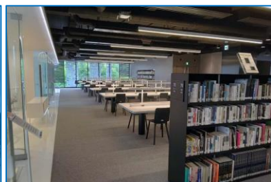
工学院大学八王子キャンパス。右は図書館内