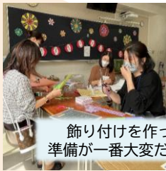
飾り付けを作って配置して...準備が一番大変だけど、楽しそう！