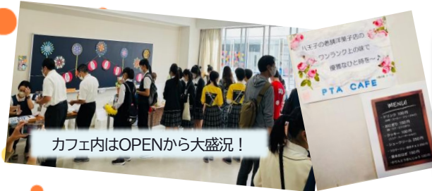
カフェ内はOPENから大盛況！

「ワンランク上の味で優雅なひとときを」のポスターの通り、八学への愛にあふれた、素敵なPTA喫茶でした。